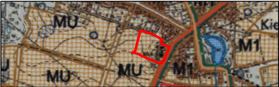
SKALA 1: 10 000

WYRYS ZE STUDIUM UWARUNKOWAŃ I KIERUNKÓW ZAGOSPODAROWANIA PRZESTRZENNEGO GMINY CZERWONAK (UCHWAŁA NR 173/XXVIII/2000 RADY GMINY CZERWONAK Z DNIA 14 CZERWCA 2000 R. ZMIENIONA UCHWAŁĄ NR 219/XXXV/2000 RADY GMINY CZERWONAK Z DNIA 13 GRUDNIA 2000 R.)