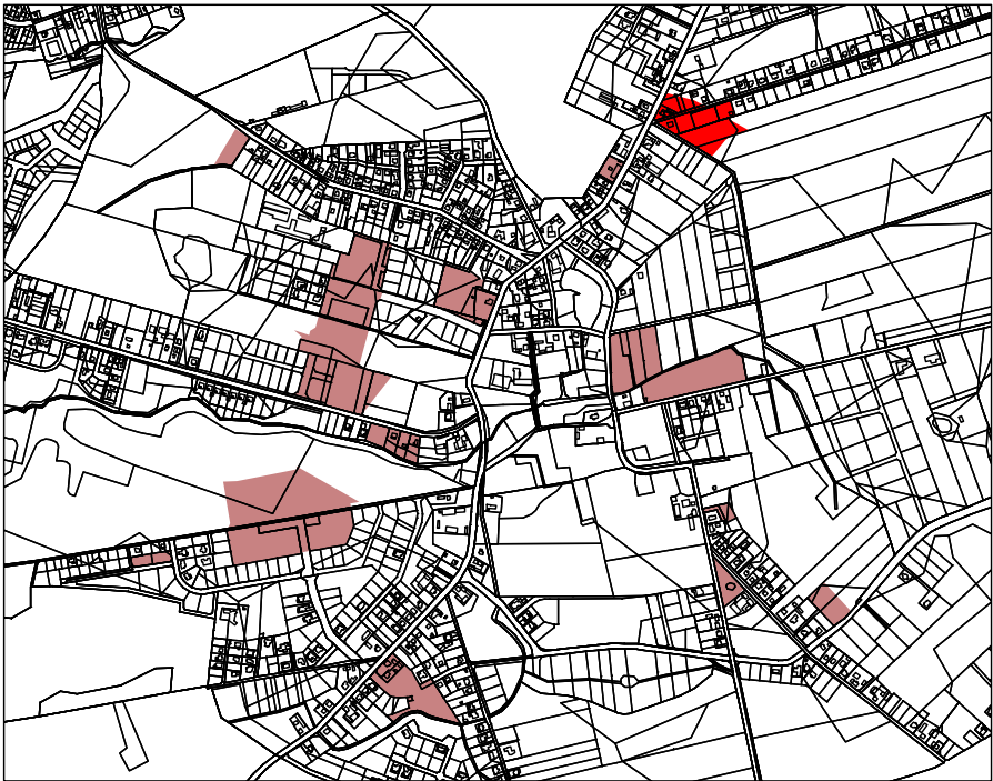
FRAGMENT NR 9 NA TŁE OBSZARÓW OBJĘTYCH ZMIANĄ MIEJSCOWEGO PLANU ZAGOSPODAROWANIA PRZESTRZENNEGO WSI KICIN

WYRYS ZE STUDIUM UWARUNKOWAŃ I KIERUNKÓW ZAGOSPODAROWANIA PRZESTRZENNEGO GMINY CZERWONAK (UCHWAŁA NR 173/XXVIII/2000 RADY GMINY CZERWONAK Z DNIA 14 CZERWCA 2000 R. ZMIENIONA UCHWAŁĄ NR 219/XXXV/2000 RADY GMINY CZERWONAK Z DNIA 13 GRUDNIA 2000 R.)