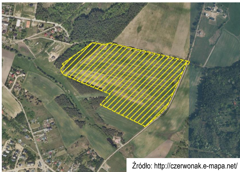
Ryc. 1 Lokalizacja obszaru objętego opracowaniem planu na tle ortofotomapy

— — — Granica obszaru objętego opracowaniem planu po podziale – część B