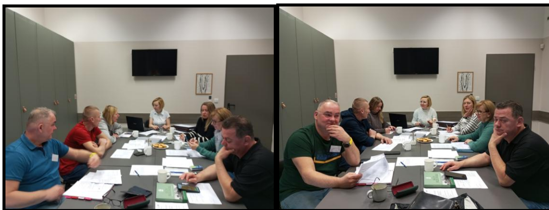
Grupa Odnovy Wsi w czasie warsztatów opracowania Sołeckiej Strategii Rozwoju Klub Jutrzenka w Kicinie w dniach 08-09.02.2025 r.