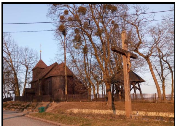
Zabytkowy kościół parafialny