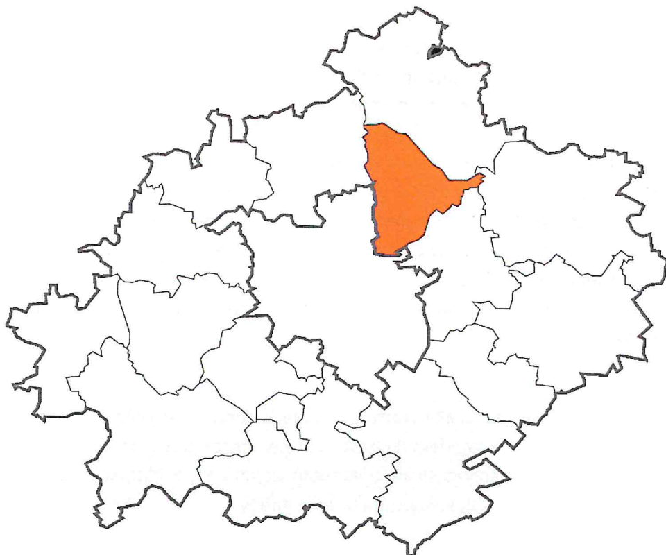
Ryc. 1. Usytuowanie gminy Czerwonak w Powiecie Poznańskim

Na gminę Czerwonak składa się 17 wsi i trzy osiedla. Są to: Annowo, Bolechowo, Bolechowo Osiedle, Bolechówko, Czerwonak, Dębogóra, Kicin, Kliny, Koziegłowy, Ludwikowo, Mielno, Miękowo, Owińska, Potasze, Promnice, Szlachęcin i Trzaskowo oraz osiedla: Karolin, Leśne i Przylesie. Administracyjnie gmina podzielona jest na 11 sołectw: Bolechowo, Bolechowo-Osiedle, Bolechówko, Promnice, Owińska, Miękowo, Czerwonak I, Czerwonak II, Koziegłowy, Kicin i Kliny.