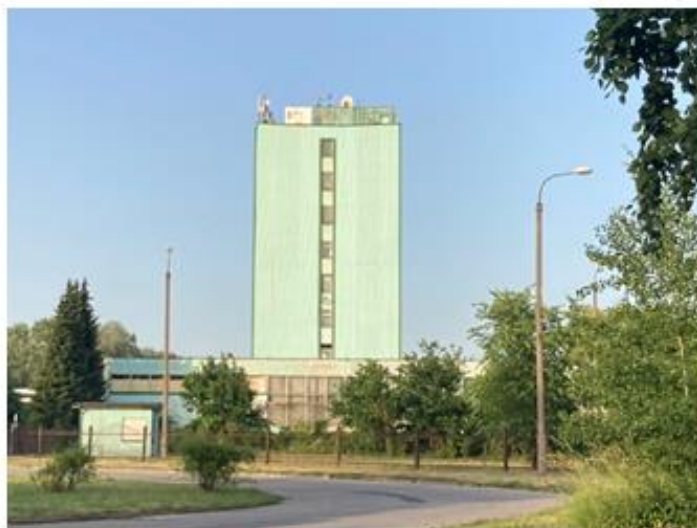
Zabudowa usługowa przy ul. Piaskowej