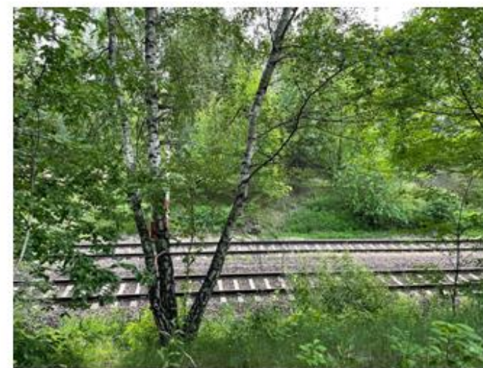
Linia kolejowa nr 395 Zieliniec - Kiekrz