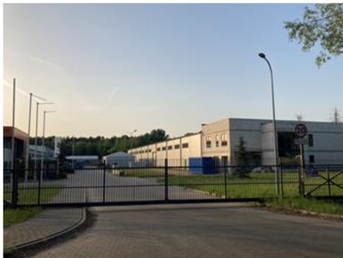
Budynki firmy Press Metal