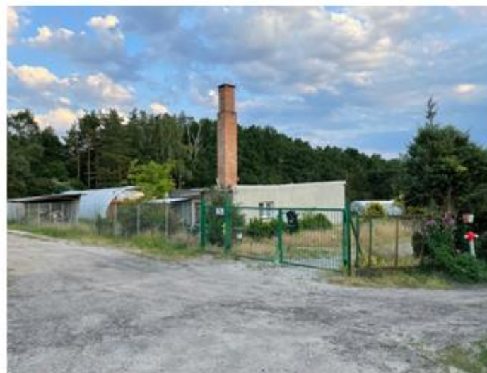
Zabudowa zagrodowa przy ul. Kwiatowej