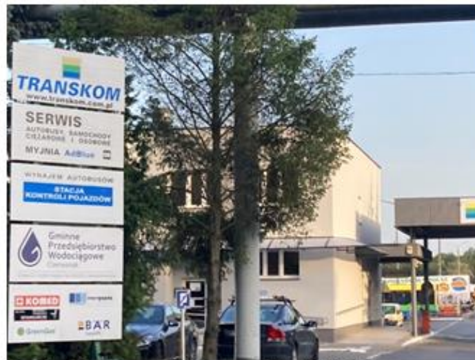
Przedsiębiorstwo wielobranżowe TRANSKOM