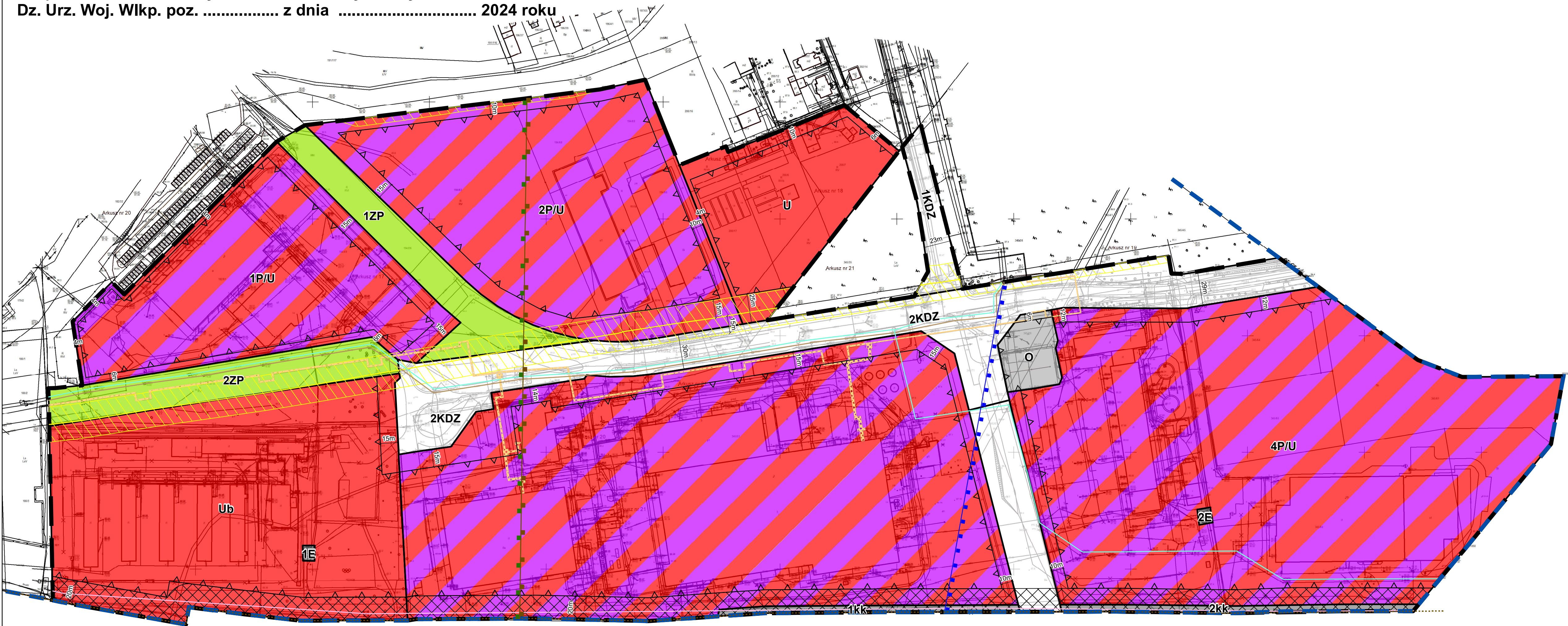
Studium uwarunkowań i kierunków zagospodarowania przestrzennego gminy Czerwonak Skala 1: 10 000