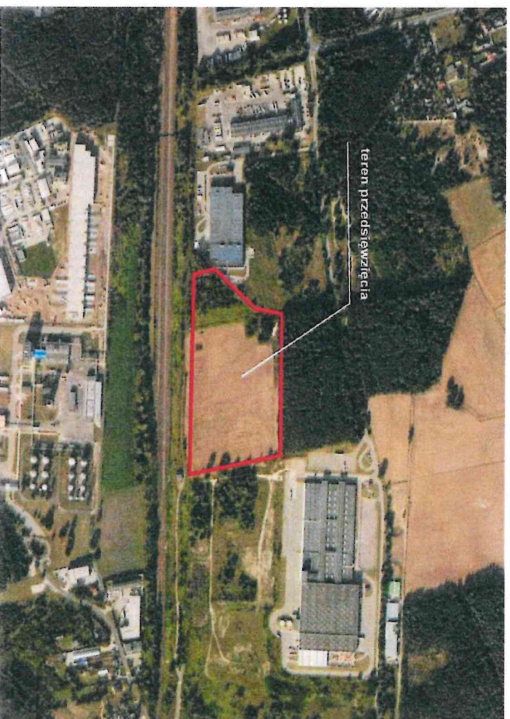
- Rysunek 1. Lokalizacja terenu przedsięwzięcia i jego otoczenia