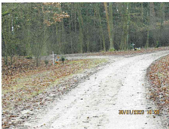
Mogiły w okolicach Maruszki