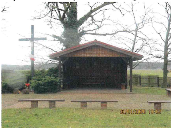
Kaplica Kościoła rzymskokatolickiego