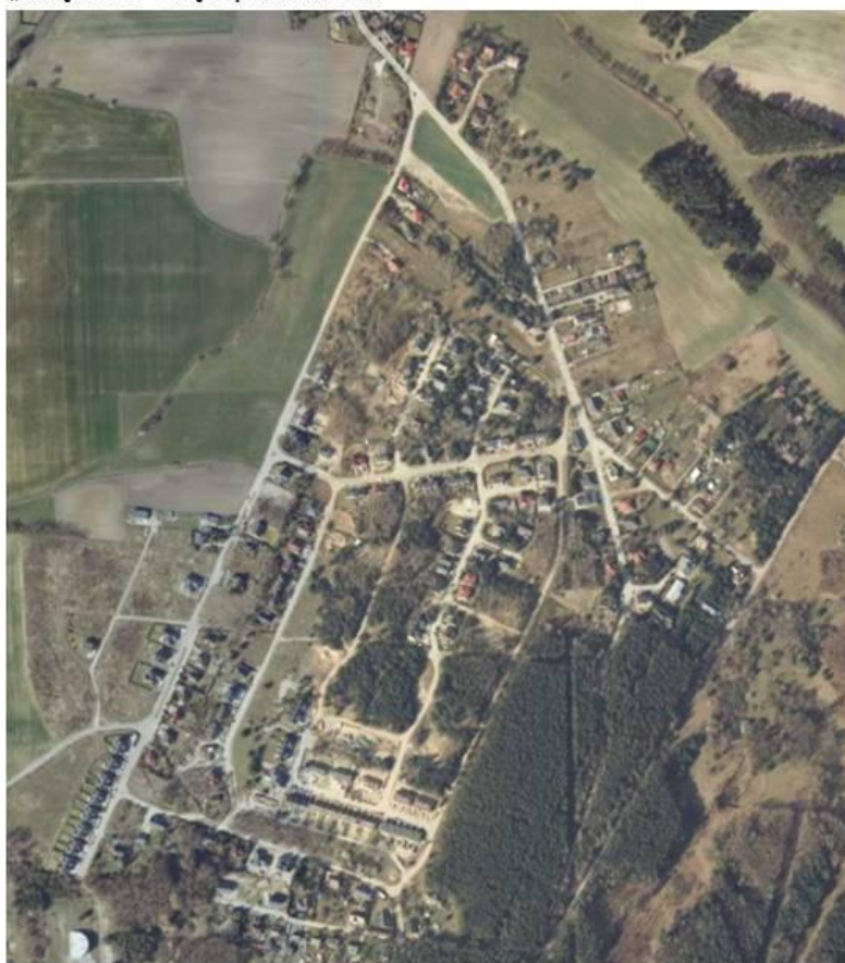
Mapa lotnicza terenu miejscowego planu zagospodarowania przestrzennego „Miękowo – część południowa”