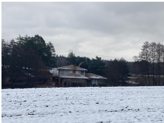
Budynek mieszkalny wolnostojący przy ul. Czeresniowej