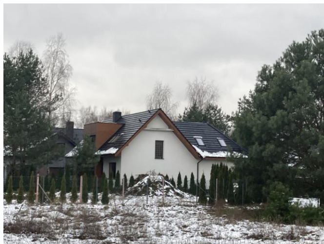
Budynek mieszkalny wolnostojący przy ul. Ogrodowej