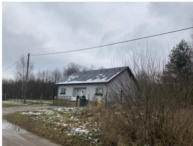
Budynek mieszkalny wolnostojący przy ul. J. Słowackiego