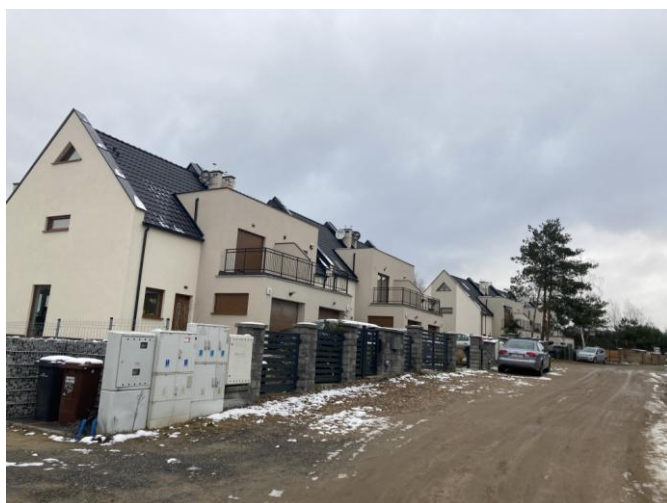
Zabudowa bliźniacza przy ul. Zawilcowej