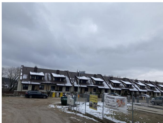
Zabudowa szeregowa przy ul. Narcyzowej