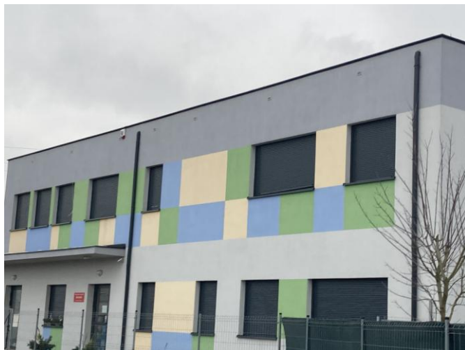
Niepubliczne przedszkole Educandi przy ul. Ogrodowej