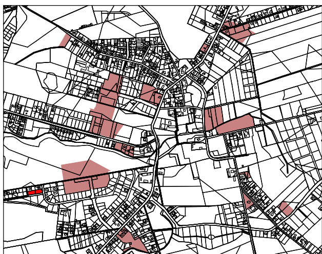
FRAGMENT NR 1 NA TLE OBSZARÓW OBJĘTYCH ZMIANĄ MIEJSCOWEGO PLANU ZAGOSPODAROWANIA PRZESTRZENNEGO WSI KICIN

WYRYS ZE STUDYUM UWARUNKOWAŃ I KIERUNKÓW ZAGOSPODAROWANIA PRZESTRZENNEGO GMINY CZERWONAK (UCHWAŁA NR 173/XXVIII/2000 RADY GMINY CZERWONAK Z DNIA 14 CZERWCA 2000 R.