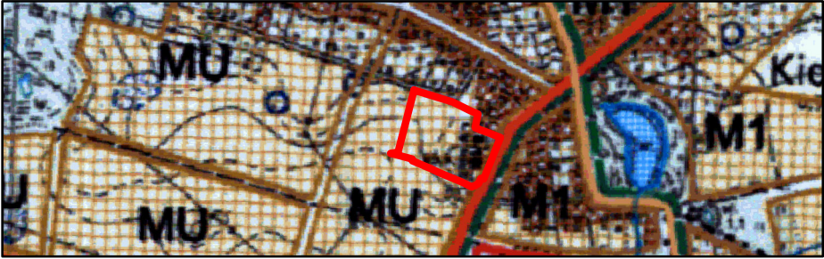
SKALA 1: 10 000

WYRYS ZE STUDIUM UWARUNKOWAŃ I KIERUNKÓW ZAGOSPODAROWANIA PRZESTRZENNEGO GMINY CZERWONAK (UCHWAŁA NR 173/XXVIII/2000 RADY GMINY CZERWONAK Z DNIA 14 CZERWCA 2000 R. ZMIENIONA UCHWAŁĄ NR 219/XXXV/2000 RADY GMINY CZERWONAK Z DNIA 13 GRUDNIA 2000 R.)